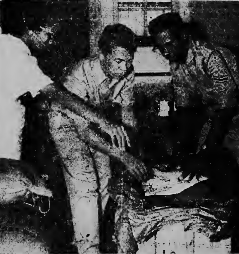
Ayer tardi nos a hanga e damanan y caballeronan di Kolonne Rode Kruis...